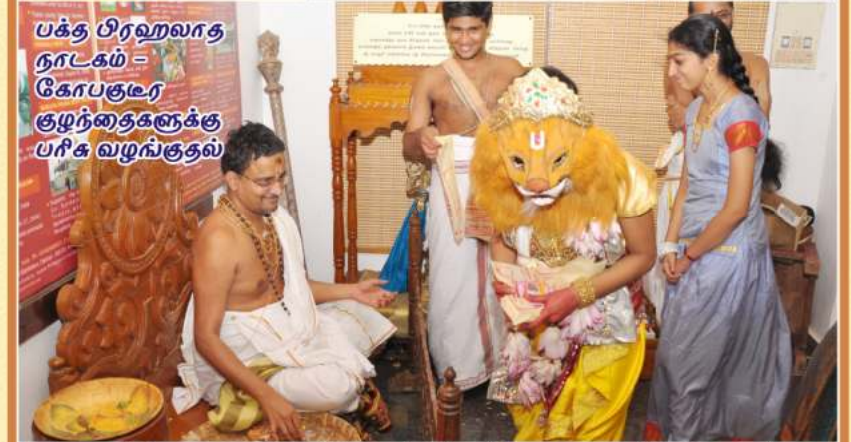
பக்த பிரஹ்மலாத நாடகம் - கோபகூடர குழந்தைகளுக்கு பரிசு வழங்குதல்