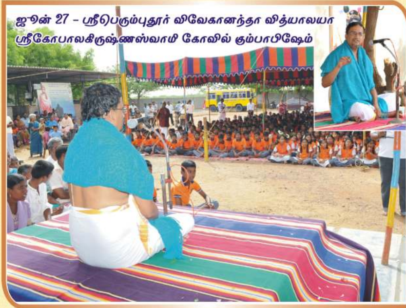
ஜூன் 27 - ஸ்ரீபெரும்புதூர் விவேகானந்தா வித்யாலயா ஸ்ரீகோபாலகிருஷ்ணஸ்வாமி கோவில் கும்பாபிஷேகம்