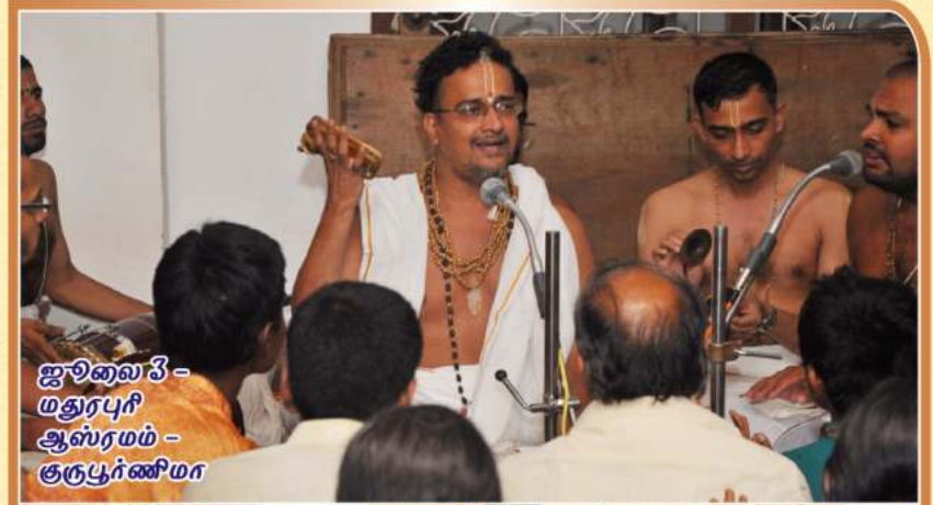
ஜூலை 3 - மதுரபுரி ஆஸ்ரமம் - குருபூர்ணிமா