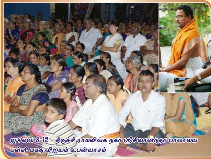
ஜூலை 8-12 - திருச்சி ராமலிங்க நகர் ஸ்ரீசிவானந்தா பாலாலய பள்ளி பக்த விஜயம் உபன்யாசம்